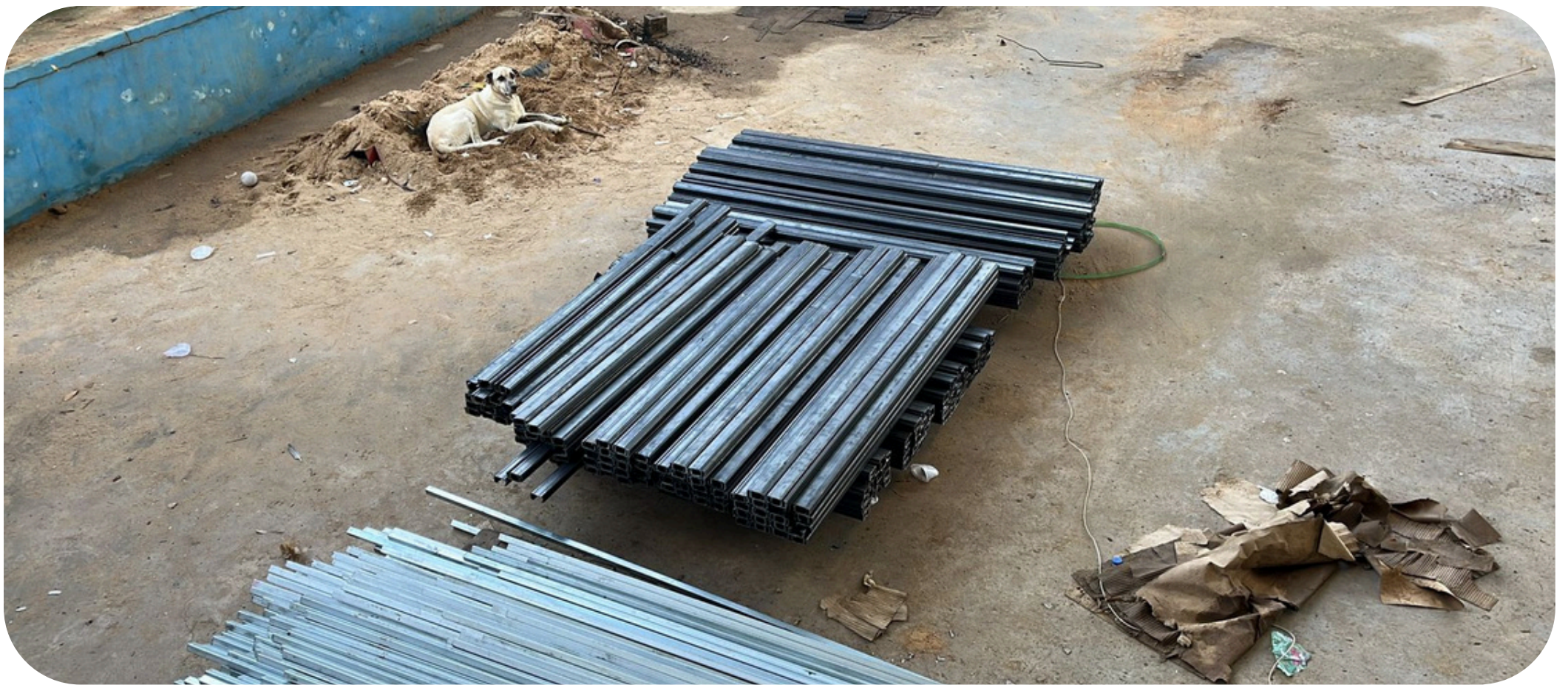
Figura 02 - Corte e preparação peças de reforço estrutural