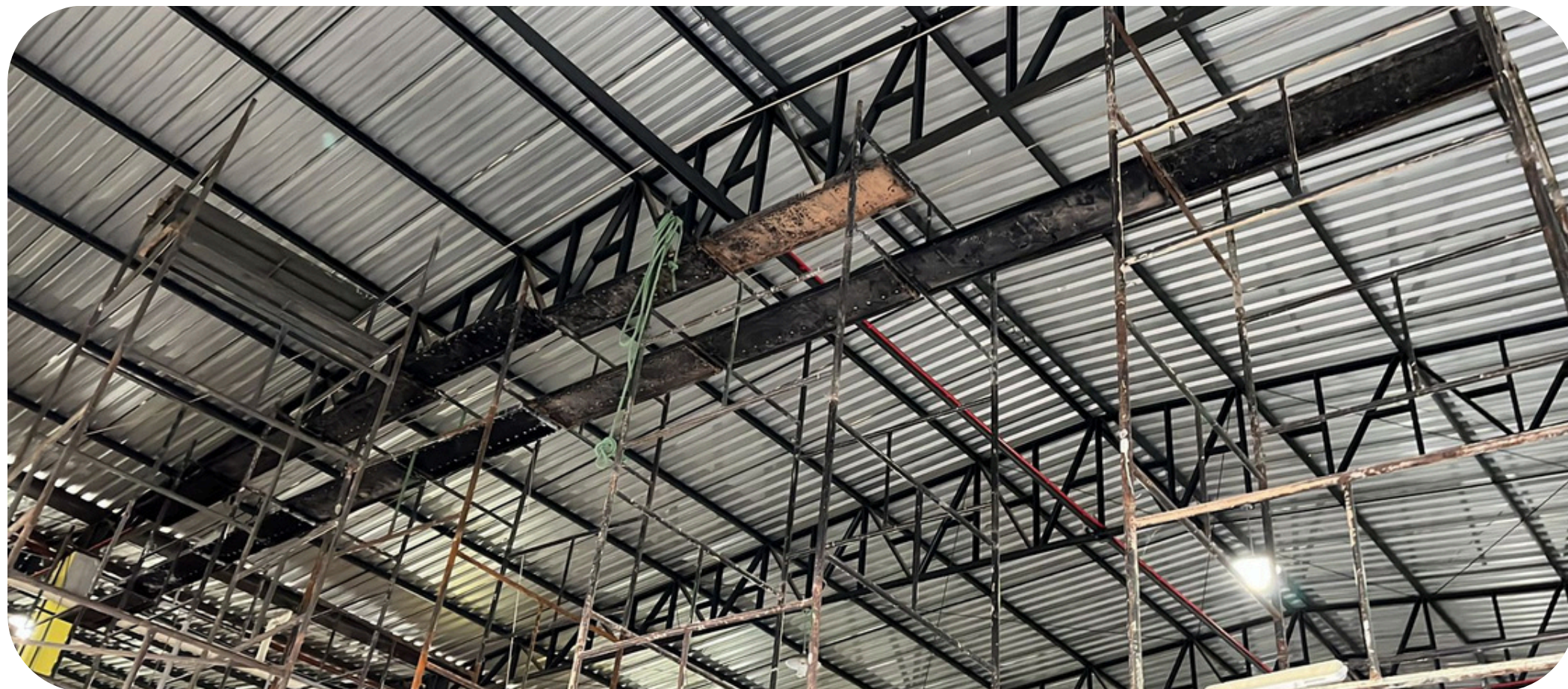
Figura 01 - Montagem andaimes