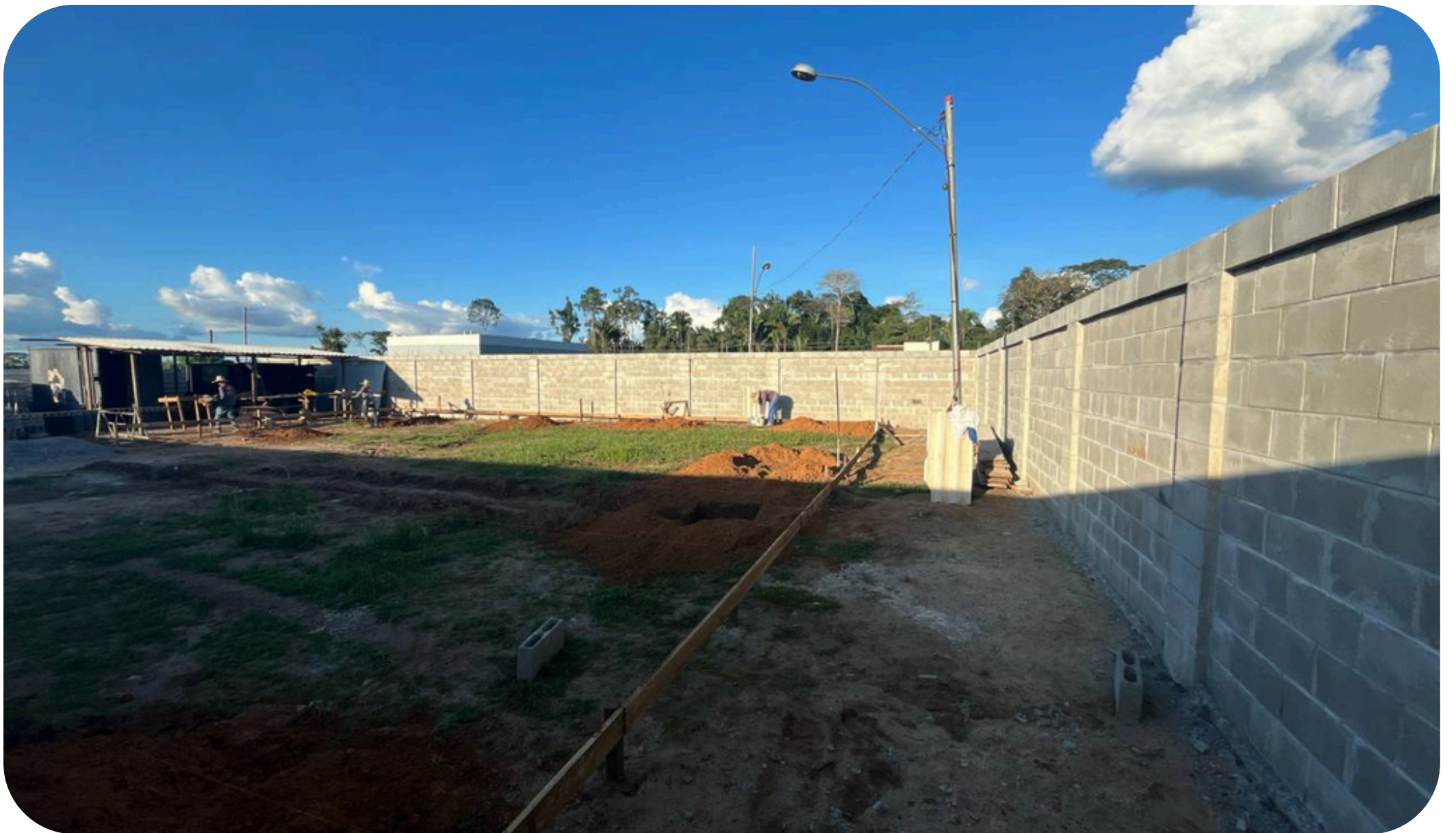
Imagem 05 - Visão geral obra