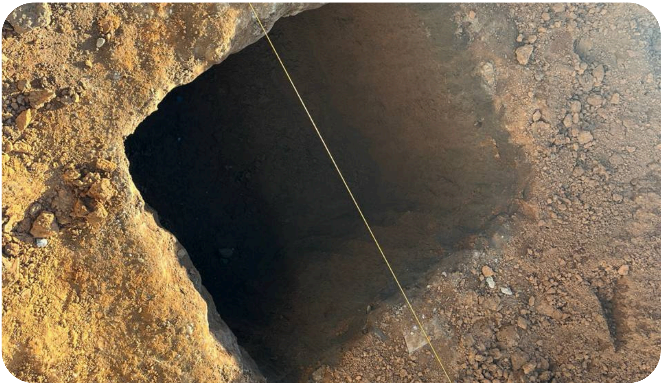
Imagem 04 - Processo de escavações sapata e vigas baldrame