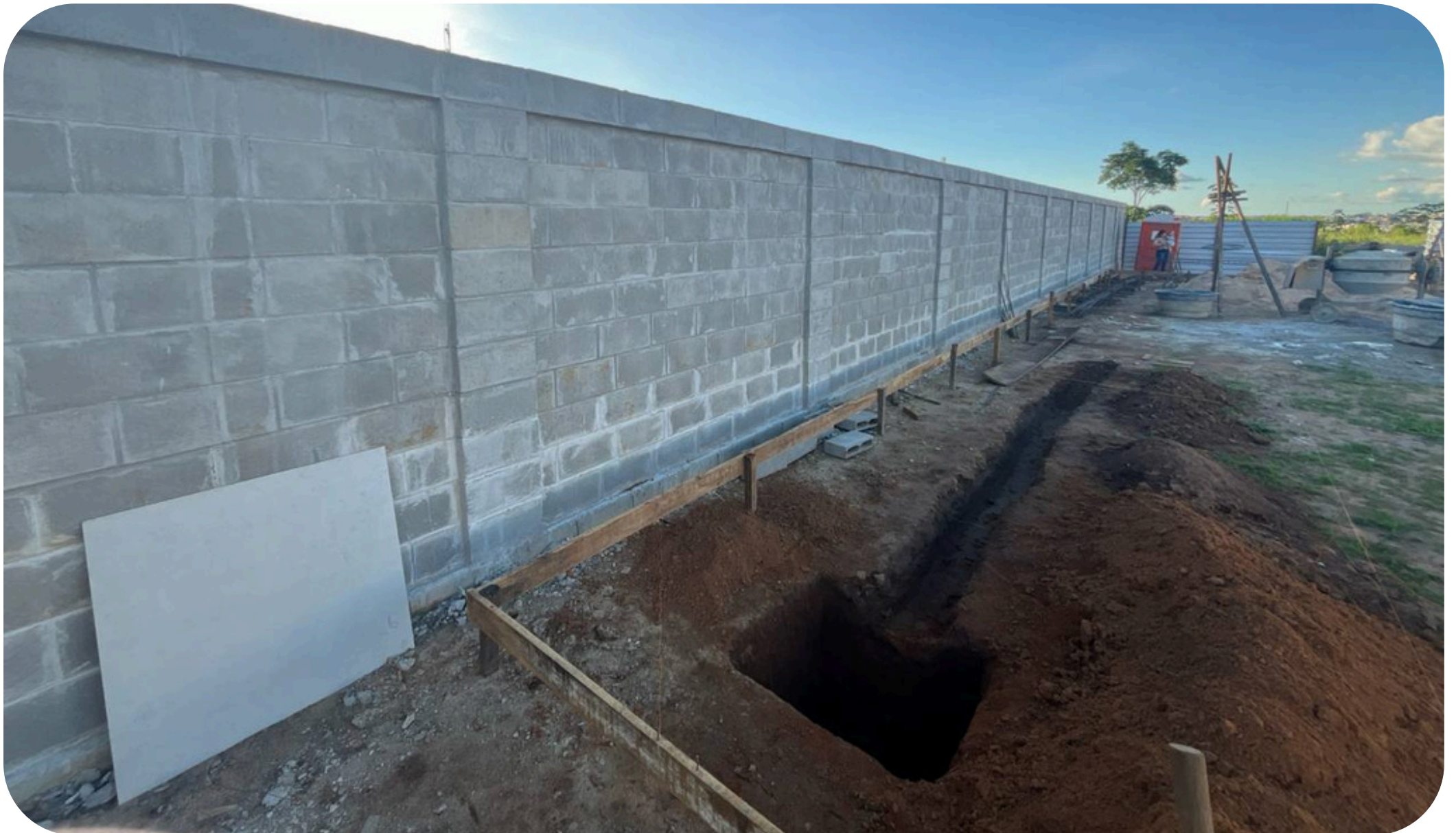
Imagem 03 - Processo de escavações sapata e vigas baldrame