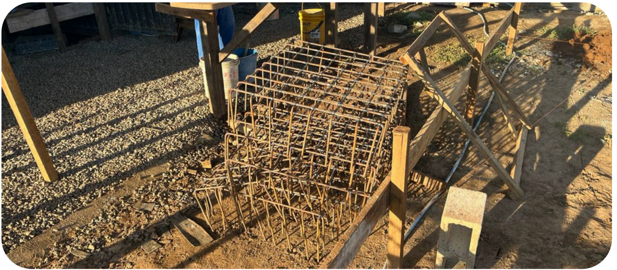
Imagem 02 - Detalhes armaduras sapatas