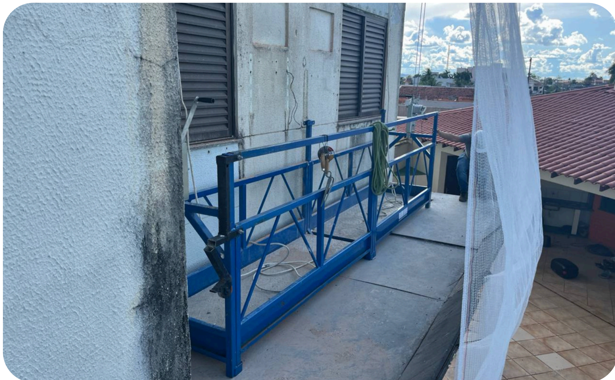
Imagem 01 - Balancim montado